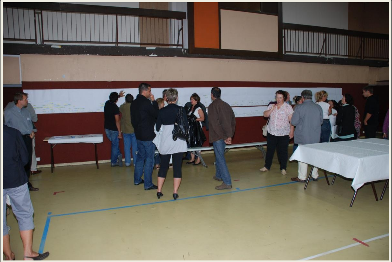
Présentation de l'arbre généalogique de la famille Claraz