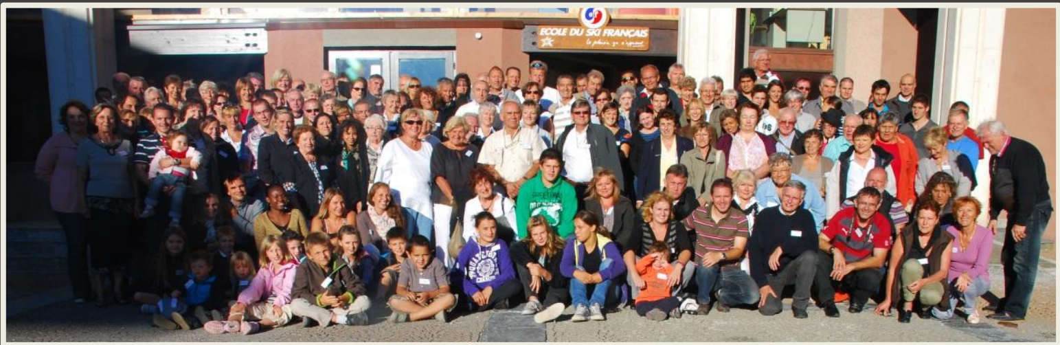
180 personnes présentes, venues de 15 départements