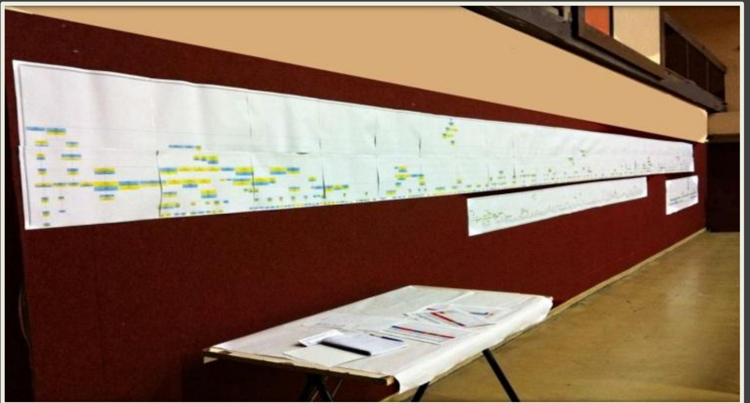
Notre arbre remonte jusqu'à 1530 et nous avons recensé 2023 personnes